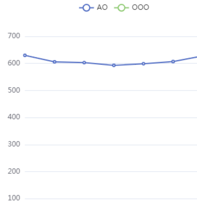
Количество эмитентов по годам